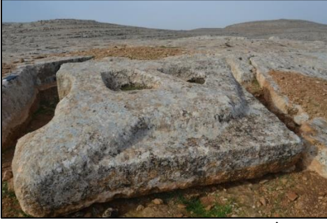
Resim 4. Aslan Kabartma Taslağının Taşocağı İçinden Görünümü (Foto. Semih Mutlu).