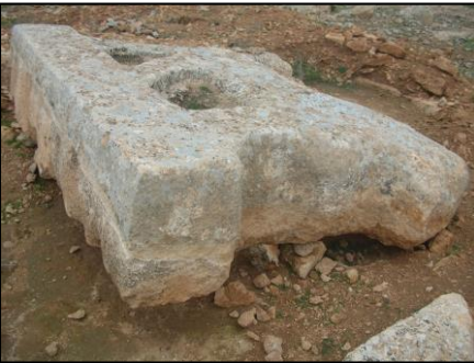
Resim 3. Aslan Kabartma Taslağının Yandan Görünümü.