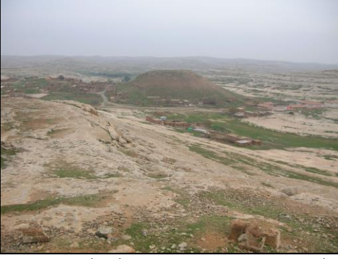
Resim 1. Soğmatar Kült Alanının ve Höyüğü'nün Batıdan Görünümü.