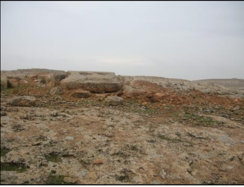
Resim 2. Taş Ocağının ve Aslan Kabartma Taslağının Doğudan Görünümü.