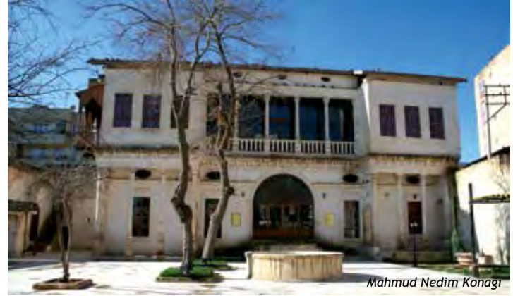
Mahmud Nedim Konağı

Eski Devlet Hastanesi yakınındadır. 1903 tarihinde inşa edilmiştir. Avrupai tarzda konak mimarisi ile geleneksel tarzda Urfa evi mimarisinin kaynaştığı bir özelliğe sahip olan ve oldukça geniş bir alana yayılan konak, haremlik ve selamlık bölümlerinden meydana gelmiştir. 1940'lı yıllarda Halk Tiyatrosu bu binada gösteriler yapmıştır. Konak, Şanlıurfa Valiliği tarafından onarılmış ve 11 Nisan 2009'da “Şanlıurfa Kurtuluş Müzesi” olarak hizmete sunulmuştur. Ayrıca Konağın bir bölümü, Devlet Türk Halk Müziği Korosu'na tahsis edilmiştir.