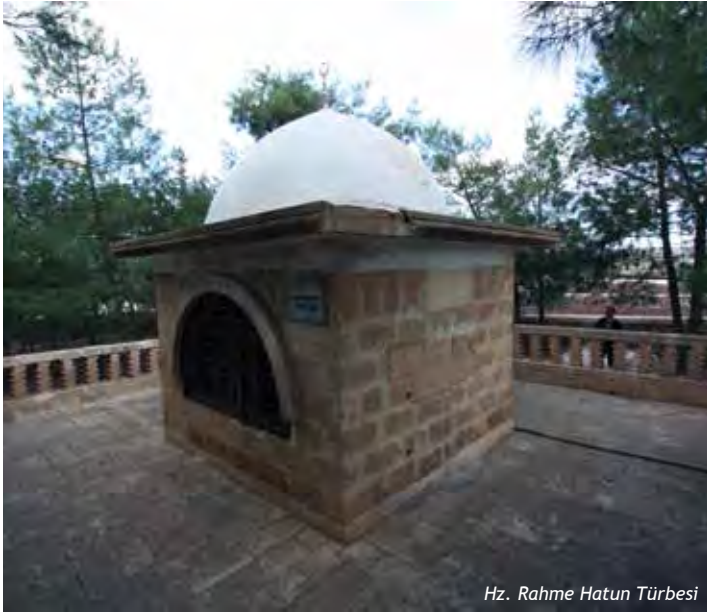
Hiz. Rahme Hatun Turbesi