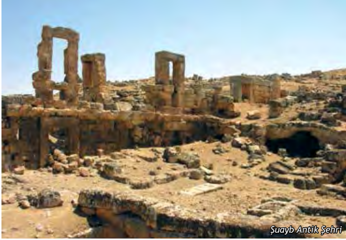
Şuayb Antik Şehri

Bu yerleşim yerinde çeşitli tarihlerde bilim adamlarının yaptığı araştırmalar sonucu varılan ortak görüş, Şuayb Şehri isminin Arapçada "Eski İnsan Şehri" anlamına geldiği ve bu yerleşim içinde yer alan evlerin ise Harran Ovası'nda yaşayan insanların yazlıkları olduğu şeklindedir.