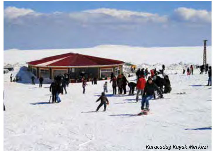
Karacadağ Kayak Merkezi

Tüm Bölge içinde kar tutan ender yerlerden olan Karacadağ'da Valilik tarafından kayak pistleri düzenlenmiştir. 600-700 m. uzunluğunda pistler için 250m.lik bir lift yapılmıştır. Siverek İlçemize 60 km. mesafede olan kayak merkezinde 60 M 2 'lik bir kafeterya ile 30 M 2 'lik bungalow tipi hizmet evi bulunmaktadır. Kasım ayından itibaren dört aylık kayma sezonu vardır.