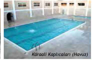
Karaali Kaplıcaları (Havuz)