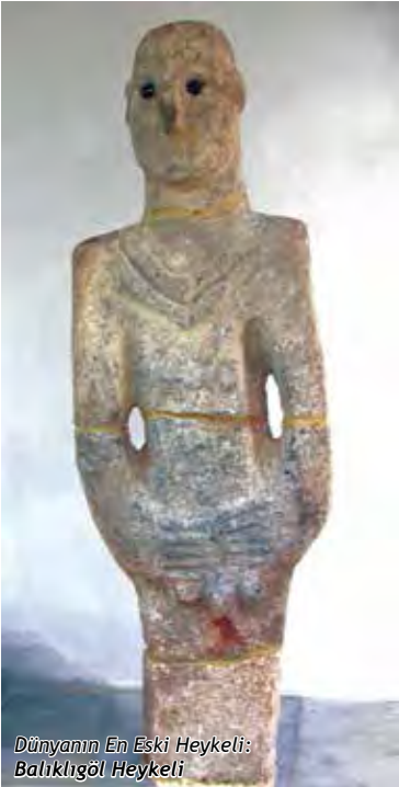
Dünyanın En Eski Heykeli: Balıklıgöl Heykeli

Şanlıurfa Arkeoloji Müzesi sahip olduğu 74.000 eser sayısı ile Türkiye'nin 5. büyük müzesidir. Paleolitik dönemden günümüze değin birçok eseri Şanlıurfa Müzesi'nde görmek mümkündür. “12.000 Yıllık Dünyanın En Eski Heykeli: Balıklıgöl Heykeli” müzemizde sergilenmektedir.