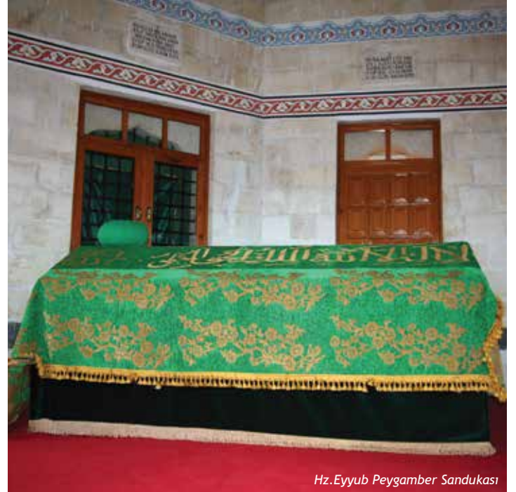
Hız. Eyyub Peygamber Sandukası

sahibi olmuştur. İmtihan öncesi sahip olduğu zenginliğe fazlasıyla sahip olmuştur. Hız. Eyyüb (a.s.)'un 93, bir başka görüşe göre 164 yaşında vefat ettiği rivayet edilir. Hız. Eyyüb (a.s.) Eyyübnebi Beldesi'ne defin edilmiştir.