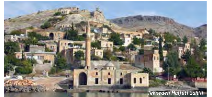
Tekneden Halfeti Sahili

İlçenin bir kısmı Birecik Barajı’nın göl suları altında kalmıştır. Yeni yerleşim yeri olarak ilçe merkezine 7 km. mesafedeki Karaotlak mevkii seçilmiş ve yerleşime açılmıştır. Kentin simgesi haline gelen ‘siyah gül’ yerli yabancı tüm konukların ilgisini çekmekte, önemli bir ticaret potansiyeli içermektedir. Teknelerle ortalama bir saat süren tekne yolculuğu ile Rumkale’ye ve tarihi Savaşan Köyüne geziler yapılabilmektedir.