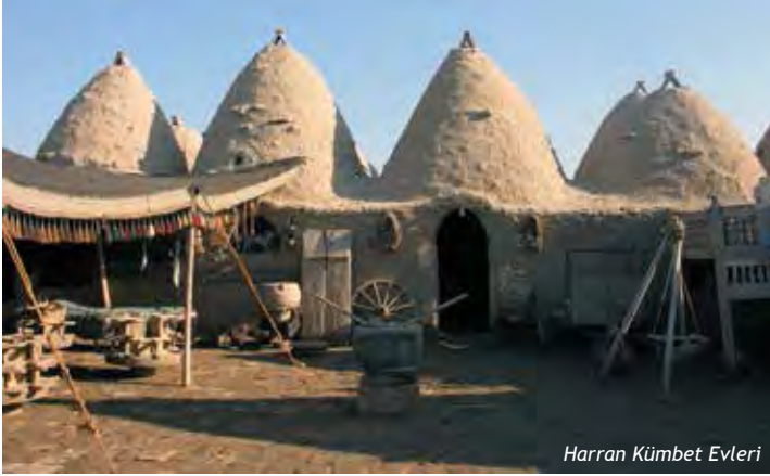
Harran Kümbet Evleri

Harran'la özdeşleşen kümbet evlerin (Konik Evler) büyük çoğunluğu hala mevcudiyetini korumaktadır. Bu evlerin benzerlerine, Şanlıurfa'ya bağlı Suruç ve Birecik kırsalındaki köylerde de rastlamak mümkündür. Ancak, Harran'daki evlerin diğerlerinden ayrılan bariz farkı, üst örtüsünde tuğla kullanılmasıdır. Harran'daki evlerinin tuğla ile örtülmesinin iki sebebi vardır. Biri, bölgenin çöl olmasından dolayı ağaç malzemenin bulunmaması, diğeri ise, Harran'da bol miktarda bulunan tuğla malzemedir. Evlerin yüksekliği içerden en çok 5 metreye varan konik külahlar, 30-40 tuğla dizisi ile örülmüştür. Örgüleri düzensiz bir şekilde balçık sıva ile bağlanan üst örtü duvarlar, içerden ve dışarıdan yine bu harçla sıvanmıştır. Harran evleri bölge iklimine uyumlu olarak yazın serin, kışın sıcaktır.