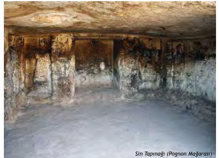
Sin Tapınağı (Pognon Mağarası)