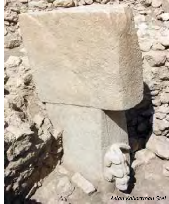
Aslan Kabartmalı Stel

Şanlıurfa İl Merkezi'nin 17 km doğusunda Örencik (Karaharabe) Köyü'nün 3 km kuzeydoğusunda yer alan Göbeklitepe, adını bölgede bulunan yatır mezardan (ziyaretten) almaktadır. İlk kez 1963 yılında İstanbul ve Chicago Üniversitelerinin işbirliği ile hazırlanan "Güneydoğu Anadolu Bölgesi Araştırma Projesi" çerçevesinde gerçekleştirilen yüzey araştırmalarında, İstanbul Üniversitesinden Prehistorya Bölüm Başkanı Prof. Dr. Halet ÇAMBEL ve Chicago Üniversitesinden Prof. Dr. Robert BRAIDWOOD tarafından keşfedilmiştir.