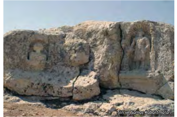
Sin ve Şamaş Kabartmaları

Soğmatar Antik Şehri Merkez ilçe sınırlarına dâhildir. İdari olarak Harran ilçe sınırları içine girmese de Harran-Eyyubnebi Turizm yolu güzergâhında olduğu için buraya alınmıştır. Şuayb Antik Şehri'nden 18 km. sonra, Soğmatar Antik Şehri'ne varılır. Burası, Harran'a ise 57 km. mesafededir. Roma dönemine (M.S. 2. yüzyıl) tarihlenen bölge, Abgar Krallığı döneminde Harranlıların Tektak Dağları bölgesinde; ay ve gezegen tanrıları için tapındıkları bir kült merkezi olduğu kabul edilmektedir. Soğmatar kült yerinde; Ay tanrısı Sin'e tapınılan bir mağara (Pognon Mağarası), yamaçlarında yer yer tanrı kabartmalarının ve zemine kazılmış yazıtların olduğu bir tepe (Kutsal Tepe), 6 adet kare ve yuvarlak planlı mozole (Anıt Mezar), iç kale ve ana kayaya oyulmuş çok sayıda kaya mezarı bulunmaktadır.