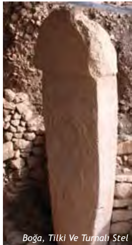
Boğa, Tilki Ve Turnalı Stel