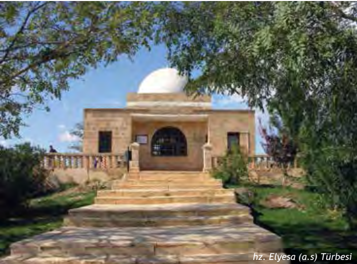
hiz. Elyesa (a.s.) Turbesi

Hiz. Elyesa (a.s.) Hiz. Eyyub'un çağdaşıdır. Rivayete göre; Şam diyarından göç ederek Hiz. Eyyub (a.s.)'u görmeye gelen Hiz. Elyesa, Eyyubnebi Köyü'ne vardığında yoluna şeytan çıkar, yaşlı bir insan kılığında Hiz Elyesa'ya görünür ve O'na "Ey yaşlı insan boşuna yorulma Eyyub'u bulamasın O buralardan göç etti çok uzaklara gitti bu yaşlı halinle O'nu bulman mümkün değil" diyerek Hiz. Elyesa'yı kandırır. Hiz. Elyesa artık yaşlanmıştır yürüyecek gücü kalmamıştır, hemen oracıkta Rabbine sığınarak