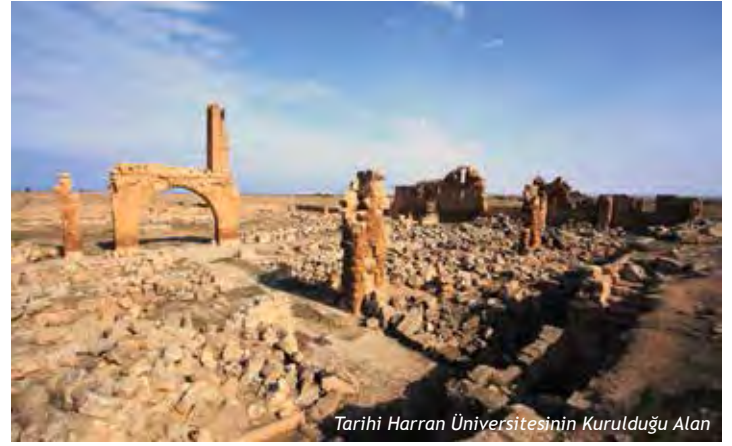
Tarihi Harran Üniversitesinin Kurulduğu Alan

Bu Ekollerin oluşmasında Harran'daki mütercimlerin, Yunan Felsefesi konulu Latince yazılmış eserlerden Arapçaya yaptıkları çeviriler önemli rol oynamıştır.