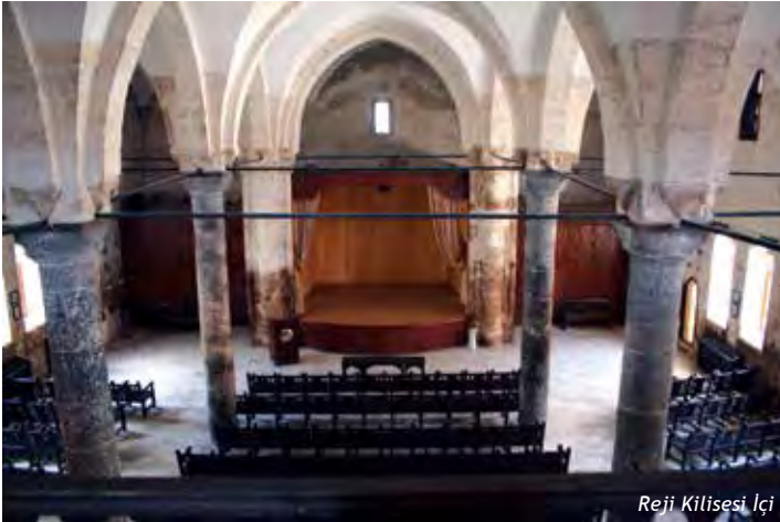
Reji Kilisesi İçi

Aziz Petrus ve Aziz Paulus Kilisesi, 1924 yılında Tekel idaresi tarafından önce tütün fabrikası sonra üzüm deposu olarak kullanılır. Kilise, halk tarafından Tekel kelimesinin Fransızca karşılığı olan Regie (Reji)'den dolayı "Reji Kilisesi" olarak isimlendirilmiştir. Kiliseden çıkarılan yazılı mezar taşları Urfa Müzesi'nde gönderilmiştir. Kilise, Şanlıurfa Valiliği tarafından 1998 yılında restore edilerek, 24 Mayıs 2002 tarihinde "Vali Kemalettin Gazeoğlu Kültür Merkezi" olarak hizmete girmiştir. Bugün hala çeşitli sosyal etkinlikler için kullanılmaktadır.