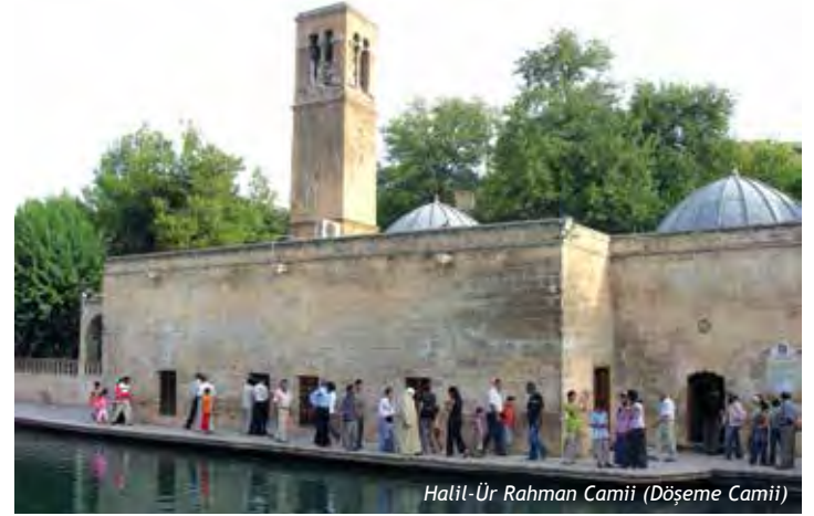
Halil-ür Rahman Camii (Döşeme Camii)

Halil-ür-Rahman Gölü'nün(Balıklıgöl) yanında yer almaktadır. Cami halk arasında "Döşeme Camisi" olarak ta isimlendirilmektedir. 504 tarihinde Rahip Urbisyus tarafından Hz. İsa Peygamber'in annesi Hz. Meryem adına bir kilise inşa ettirilmiştir.